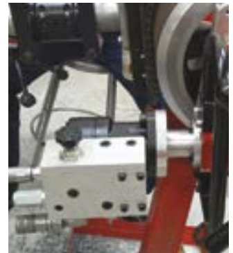
液压 (如图所示), 电动 & 气动设备