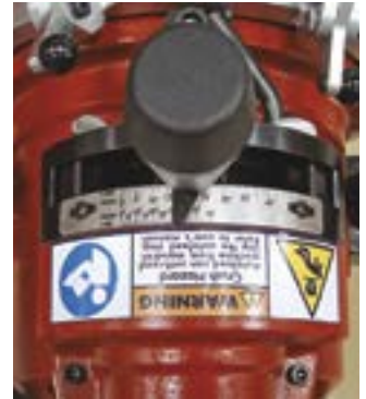
快速坡口™自动进给设备