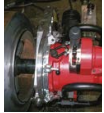
EP 424 是厚壁作业的理想设备